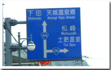
⑦出口の交差点を右折 ⇒国道136号を道なりに進みます