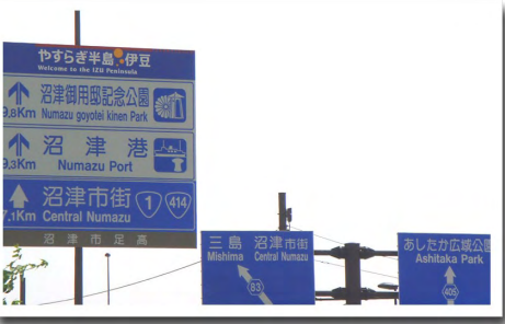
①東名高速道路沼津ICを下りたところ ⇒左に寄って標識の県道83号に進みます