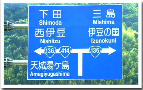
⑥修善寺道路終点のT字路を左折 ⇒左に寄り国道136号を西伊豆方面へ