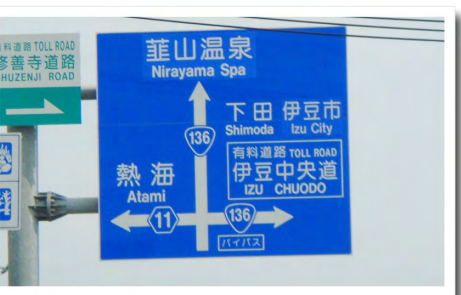
④国道136号から伊豆中央道に入る分岐点 ⇒右折して伊豆中央道に入ります