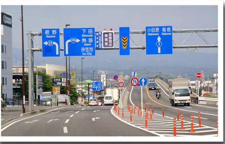
③国道1号から国道136号に入る分岐点 ⇒左側道から国道1号の陸橋下で右折します