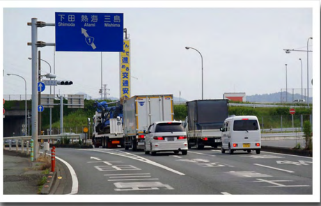
②県道83号から国道1号に入る分岐点 ⇒左に寄ります