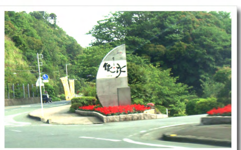
⑨運転お疲れさまです！ニュー銀水到着です ⇒国道136号の海側にあります