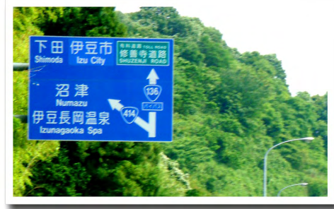
⑤伊豆中央道を直進、修善寺道路へ進みます