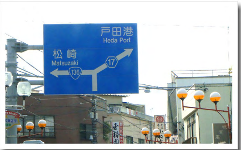
⑧土肥のT字路を左折します ⇒国道136号を道なりに約30分進みます