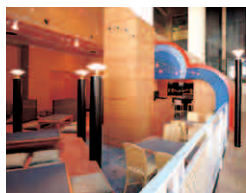
居酒屋「なぶら亭」 ■営業時間/ 20:00~25:00 (ラストオーダー/24:30)