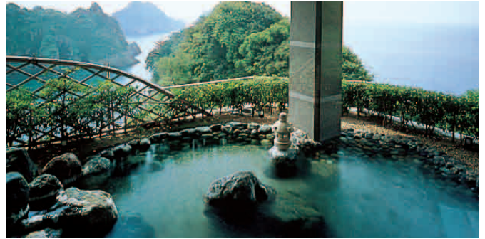
露天風呂 ■男性:2F ■女性:3F