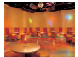
ディスコ&カラオケ 「ドーガ・ドーガ」 ■営業時間/ 20:00~24:00 ■客席数/50席