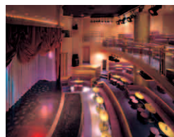
クラブ 「ムーンライト・ベイ」 ■営業時間/ 20:00~24:00 ■客席数/120席