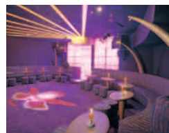
カラオケホール 「オーキッド」 ■営業時間/ 20:00~24:00 ■客席数/40席