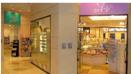
ショッピングモール「マーレ・マーレ」 ■営業時間/7:00~11:00・14:00~21:00