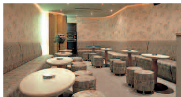
レンタルカラオケルーム 「ホップ・ステップ・ジャンプ」 ■営業時間/20:00~24:00