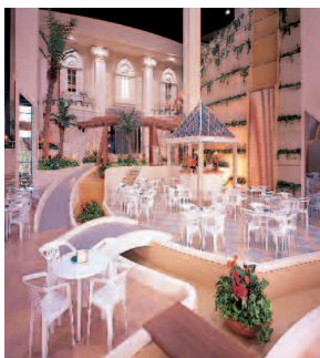
カフェ「ボルト・ボルト」 ■営業時間/14:00~23:00