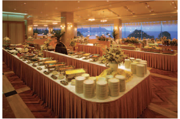
ダイニングルーム「オーシャンパレス・銀華」