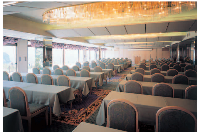
コンベンションホール