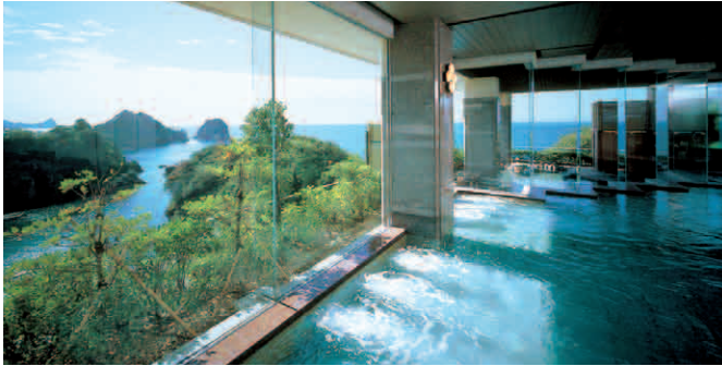
展望大浴場「天窓」 ■男性:2F ■女性:3F